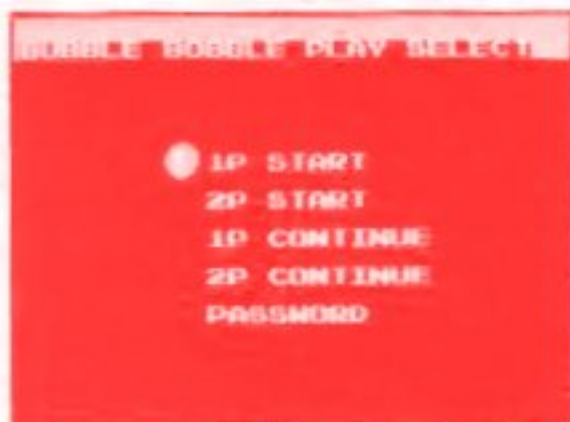
プレイセレクト画面

タイトル画面が出たら、1Pまたは2Pジョイスティックのスタートボタンを押してください。右のようなプレイセレクト画面に変わります。