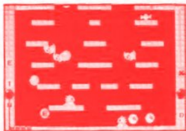
バブルのエクステンドバブル

エクステンドバブルを6種類全部そろえると、自動的に別のラウンドに移動し、挑戦回数が1回増えます。