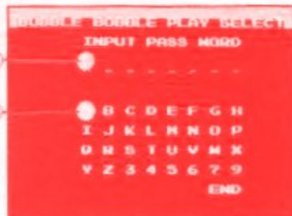
パスワード入力画面

以前ゲームをしたときに表示されたパスワードを入力すれば、途中からゲームを始めることができます。プレイセレクト画面でPASSWORDを選び、スタートボタンを押してください。そうすると、右のようなパスワード入力画面に変わります。