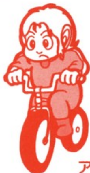
アレックス (プレイヤー)

MARKⅢにジョイスティックを取りつけているキミは、ジョイスティックを取りはずし、パドルコントロールを取りつけてください。