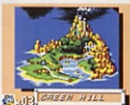
エリアマップ画面