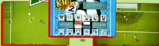
Expanded Amiga version