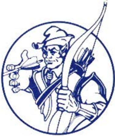
QUESTOR the Elf