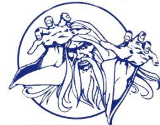
MERLIN the Wizard

U.S. Gold Ltd., Units 2/3 Holford Way, Holford, Birmingham B6 7AX. Telephone: 021 356 3388